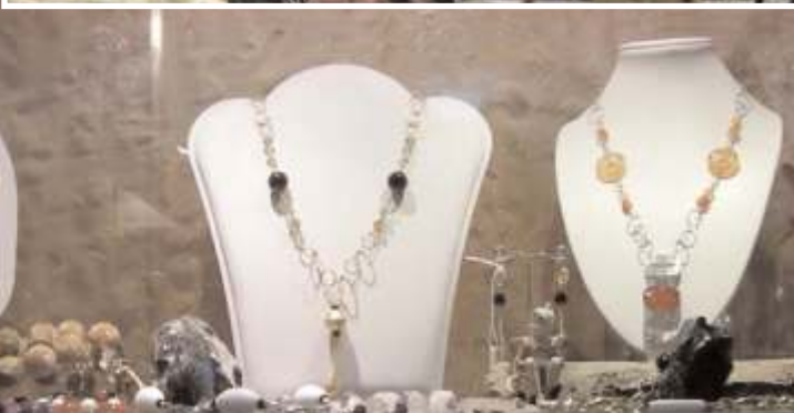
Lavorazioni in argento realizzate da Antonino Lo Meo di Palermo